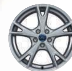
Llantas de aleación de 18"