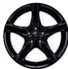
Llantas de aleación Negro Shadow de 18" y 5 radios (opcionales)

Focus ST-Line Red & Black (rojo) con llantas de aleación Negro Shadow de 18". Focus ST-Line Red & Black (negro) y llantas de aleación Negro Shadow de 18".