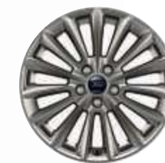
Llantas de aleación de 17" exclusivas ST-Line

Focus ST-Line en Blanco* con llantas de aleación de 18". Focus ST-Line en Plata Perla Moondust* con llantas de aleación de 18".