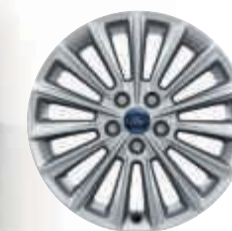
Llantas de aleación de 17"